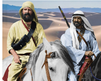
1978 LES 4 PLUMES BLANCHES (The Four Feathers) de Don Sharp avec Beau Bridges