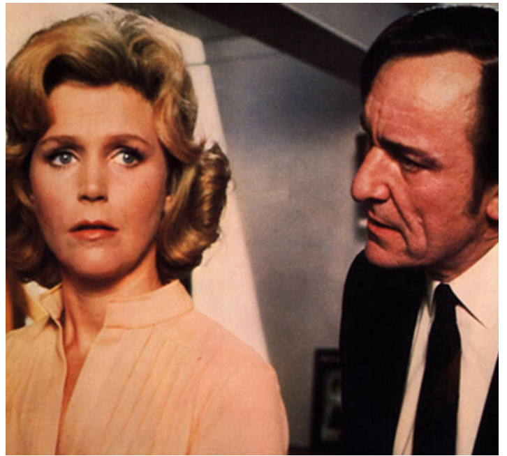
1975 LE GRAND DÉFI (Hennessy) de Don Sharp avec Lee Remick