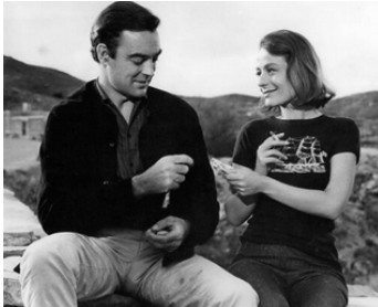
1964 L'AUTRE FEMME de François Villiers avec Annie Girardot