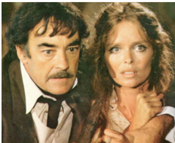
1979 LE CONTINENT DES HOMMES-POISSONS (L'Isola...) de Sergio Martino avec Barbara Bach