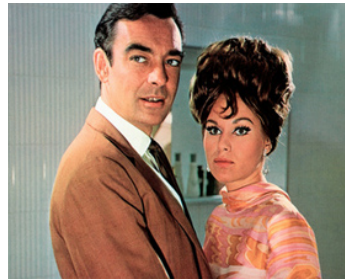
1967 PLUS FÉROCES QUE LES MÂLES (Deadlier than the Male) de R. Thomas avec Sylva Koscina