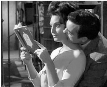
1966 LA SORCIÈRE AMOUREUSE (La strega in amore) de D. Damiani avec Rosanna Schiaffino