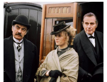
1991 LA CROIX DE SANG (The Crucifer of Blood) de Fraser C. Heston avec S. Harker, Ch. Heston