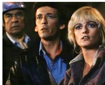
1985 WHAT WAITS BELOW de Don Sharp avec Robert Powell, Lisa Blount