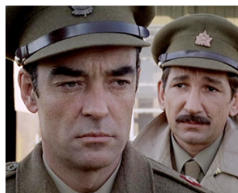
1970 À L'AUBE DU CINQUIÈME JOUR (Dio è con noi) de Giuliano Montaldo avec Relja Basic