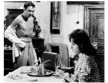
1963 LES BIJOUX DU PHARAON (Cairo) de Wolf Rilla avec Faten Hamamah