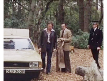
1979 A NIGHTMARE SANG IN BERKELEY SQUARE de R. Thomas avec Richard Jordan