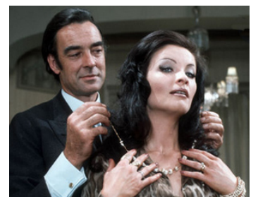
1972 A MAN ABOUT A DOG d'Alvin Rakoff avec Kate Omara