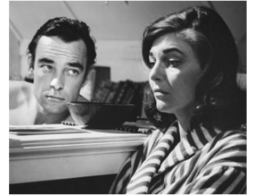
1964 LE MANGEUR DE CITROUILLES (The Pumpkin Eater) de Jack Clayton avec Anne Bancroft