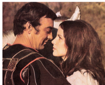
1968 LE TYRAN (Columba) de Mircea Dragan avec Antonella Lualdi