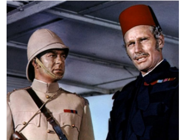
1966 KHARTOUM (Khartoum) de Basil Dearden avec Charlton Heston