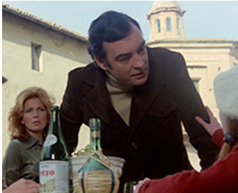
1975 ÉMILIE, L'ENFANT DES TÉNÈBRES (II medagione insanguinato) de M. Dallamano