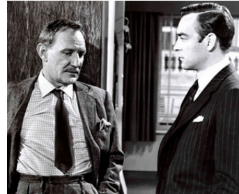
1965 OPÉRATION CROSSBOW de Michael Anderson avec Trevor Howard