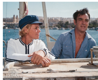
1968 DU SABLE ET DES DIAMANTS (A Twist of Sand) de Don Chaffey avec Honor Blackman