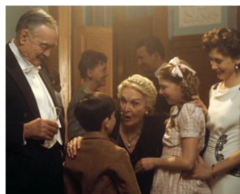
2008 LE GARÇON AU PYJAMA RAYÉ de Mark Herman avec Sheila Hancock, Amber Beattie