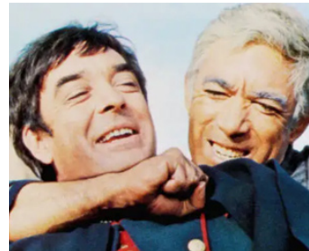
1967 PEYROL LE BOUCANIER (The Rover) de Terence Young avec Anthony Quinn