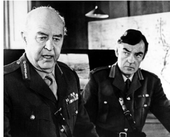
1976 LE TIGRE DU CIEL (Aces High) de Jack Gold avec Ray Milland