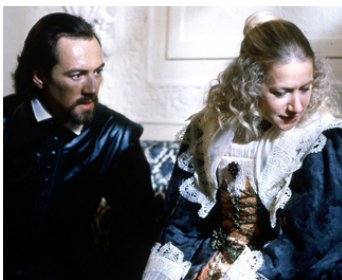
1982 CYMBELINE (Cymbeline) d'Elijah Moshinsky avec Helen Mirren