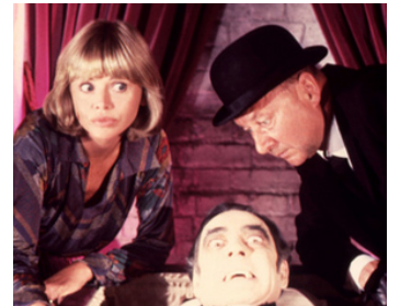
1981 LE CLUB DES MONSTRES (The Monster Club) de Roy W. Baker avec B. Ekland, D. Pleasence