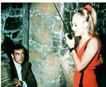
1969 DIEU PARDONNE, ELLE JAMAIS (Some Girls do) de Ralph Thomas avec Sydne Rome