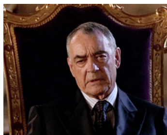
2001 LARA CROFT, TOMB RAIDER (Lara Croft: Tomb Raider) de Simon West