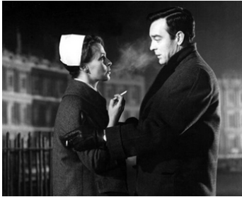
1963 80 000 SUSPECTS (80,000 Suspects) de Val Guest avec Claire Bloom