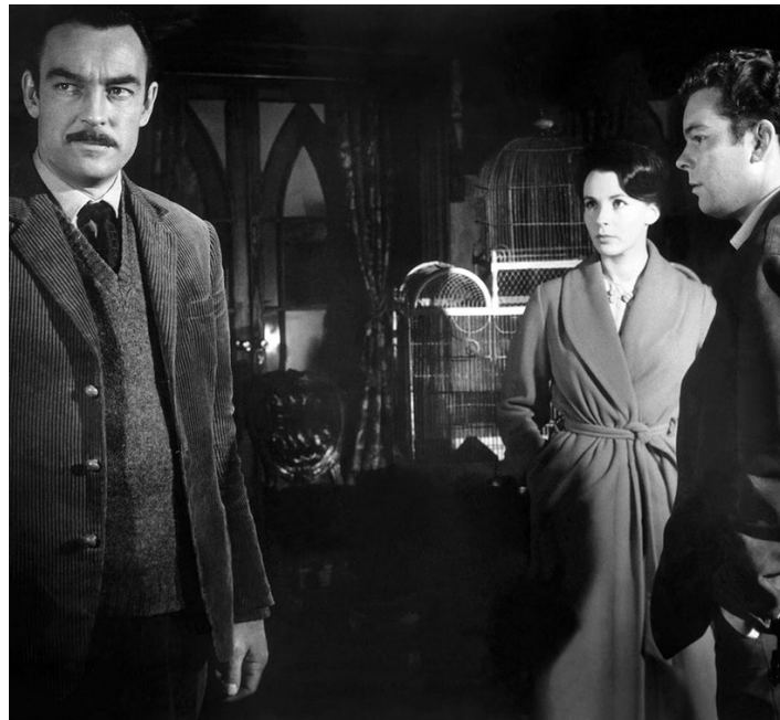
1963 LA MAISON DU DIABLE (The Haunting) de Robert Wise avec Claire Bloom, Russ Tamblyn