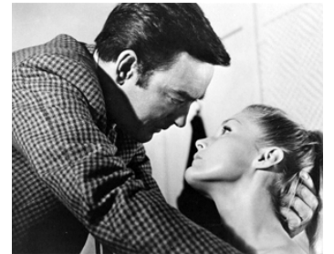
1967 LE COUP DU LAPIN (Danger Route) de Seth Holt avec Carol Lynley