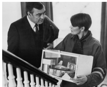
1985 TURTLE DIARY (Turtle Diary) de John Irvin avec Glenda Jackson