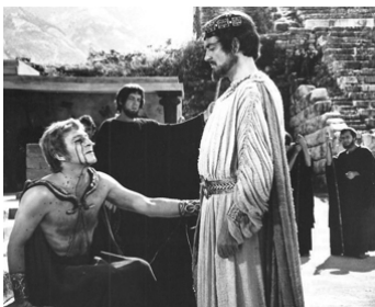
1968 ŒDIPE ROI (Edipus the King) de Philip Saville avec Christopher Plummer