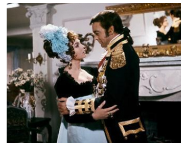
1968 LES AMOURS DE LADY HAMILTON de Christian-Jaque avec Michèle Mercier