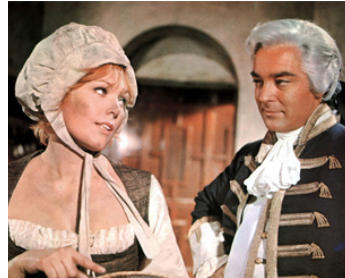
1965 MOLL FLANDERS (Moll Flanders) de Terence Young avec Kim Novak