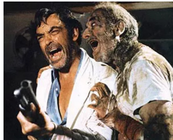
1979 L'ENFER DES ZOMBIES (Zombies 1) de Lucio Fulci