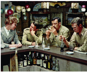
1959 LA PROIE DES VAUTOURS (Never so few) de J. Sturges avec F. Sinatra, Steve McQueen