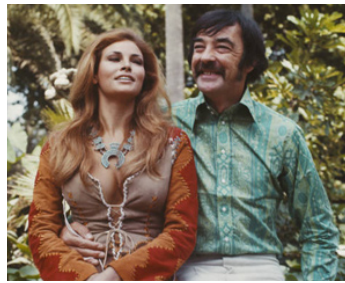
1974 LE PÉCHÉ (The Beloved) de George Pan Cosmatos avec Raquel Welch